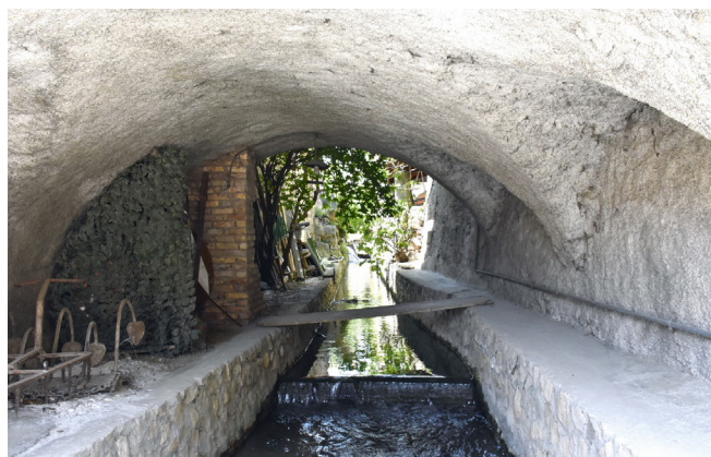
La roggia ai "Busi"

erano chiamate "lavandari". I più visibili ancora oggi si trovano in via F. Panizza; un altro, in via Canè, è chiamato proprio "El Lavandar" ed è ora adibito a deposito; un altro ancora si trovava nei pressi di piazzale Leonardelli, ma di questo non vi è più traccia.