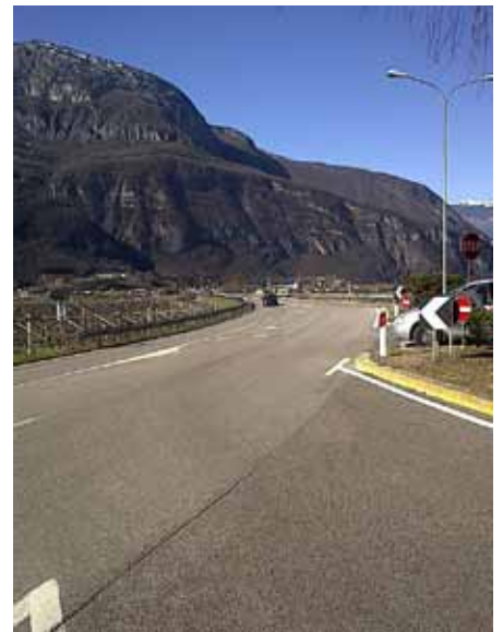
“Finalmente arriva la rotatoria”

tanti anni di richieste e di attese, è finalmente esecutiva la realizzazione di una rotatoria stradale in località “Galletta”. Un intervento quanto mai necessario per mettere in sicurezza l'entrata e l'uscita veicolare, dando finalmente un degno accesso ad una borgata di oltre