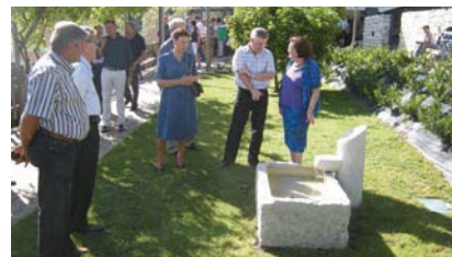
Inaugurazione Giardino Schwabl.

Il notevole impulso dato dalla Provincia Autonoma di Trento alla promozione della qualità dell'assistenza socio-sanitaria esprime l'esigenza condivisa di operare concretamente affinché questa assistenza sia di elevato livello tecnico-professionale ed appropriata rispetto ai reali bisogni di salute, psicologici e relazionali della persona. La qualità della cura e dell'assistenza è strettamente legata alla qualità degli operatori, perché sono le loro competenze tecniche e professionali che possono "fare la differenza". Perciò oggi, più che in passato, è necessario investire nella formazione tecnica di base e continua, ma soprattutto nel campo dell'etica professionale e delle relazioni, allo scopo di qualificare ed umanizzare il rapporto con le persone assistite e con i colleghi di lavoro.