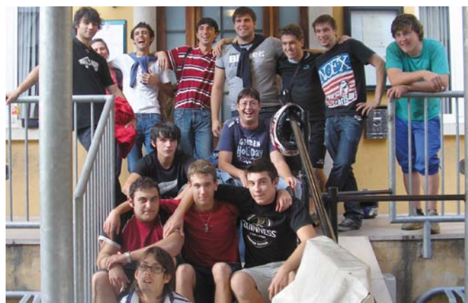
I ragazzi di Telemaco

Ricordiamo a tutti che per qualsiasi informazione potete collegarvi al nostro sito www.telemacogiovani.it o telefonare al numero 0461\602291