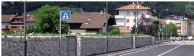
Una veduta di via Rotaliana

Altro lavoro importante portato a termine è stato quello del marciapiede in Via Rotaliana, nel tratto Via dei Camorzi - Galletta con anche il rifacimento del muro a secco così da mantenere il ricordo delle vecchie "cente" che circondavano le campagne ed i masi di Mezzocorona. Così come da ricordare è il lavoro di pavimentazione della Via alla Grotta. Lavoro che anch'esso ha creato diversi disagi ai residenti della Via ed ai turisti del Monte ma che, di fatto, ci ha restituito i "Laiti" nella sua splendida bellezza, ricevendo diversi positivi attestati da parte di tanti cittadini e turisti che frequentano il Monte e la passeggiata che porta alla Grotta della Madonna.