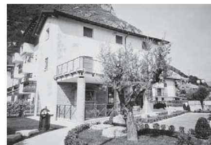
La domus romana