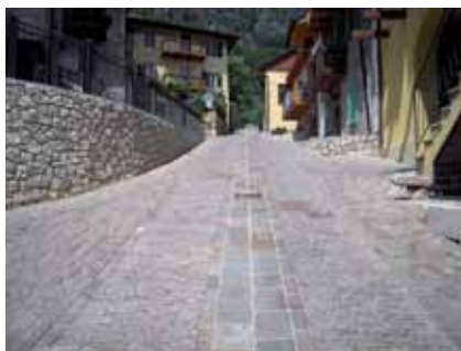
Via alla Grotta: eseguiti i lavori di pavimentazione

convogliamento delle acque piovane al centro strada richiede la risagomatura della sezione stradale e quindi l'abbassamento di diverse camerette e pozzetti.