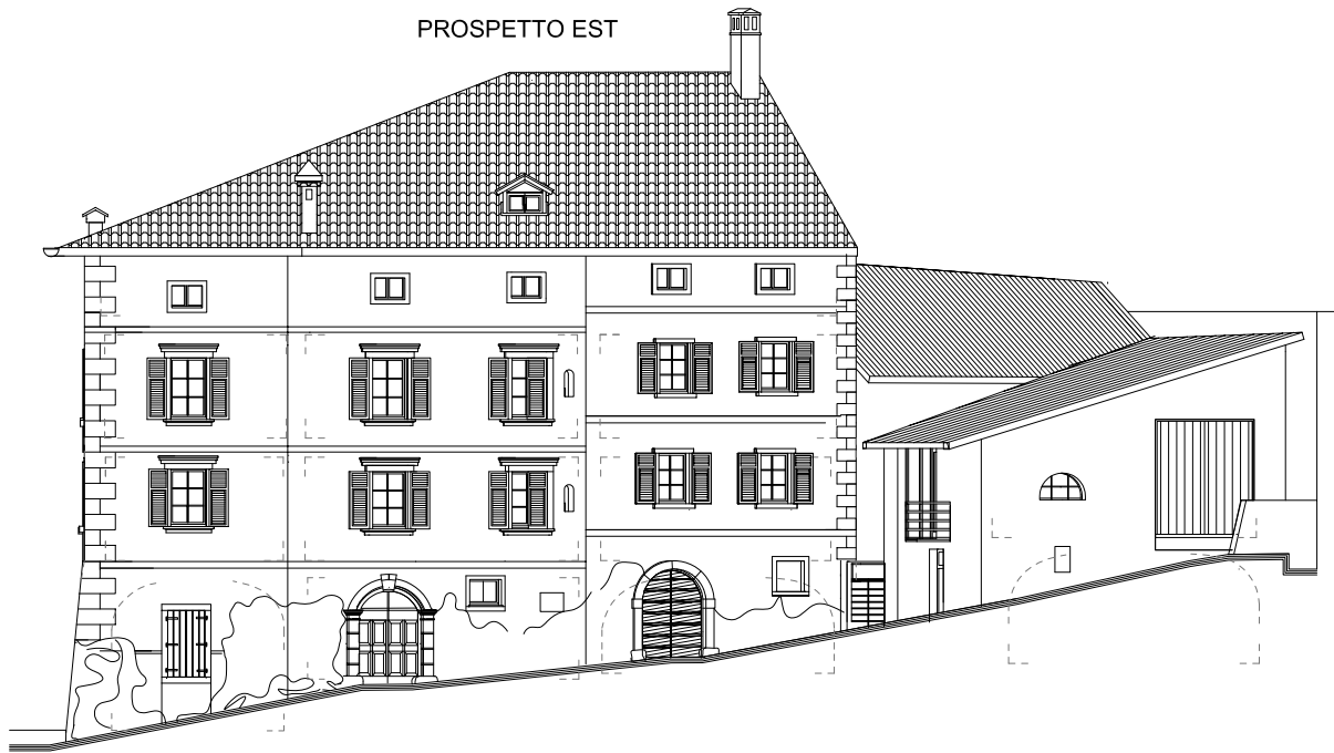
Prospetto ex Casa Chietini

prevede spese per complessivi € 7.785.240,00. E' un bilancio importante, e anche se è l'ultimo di questo nostro mandato amministrativo pone le basi per avviare ed in qualche caso anche completare delle opere importanti per il nostro paese. Dopo l'impegno di spesa per l'appalto relativo alla costruzione delle nuove scuole medie effettuato nel bilancio 2013 per un importo di € 12.540.000,00 opera