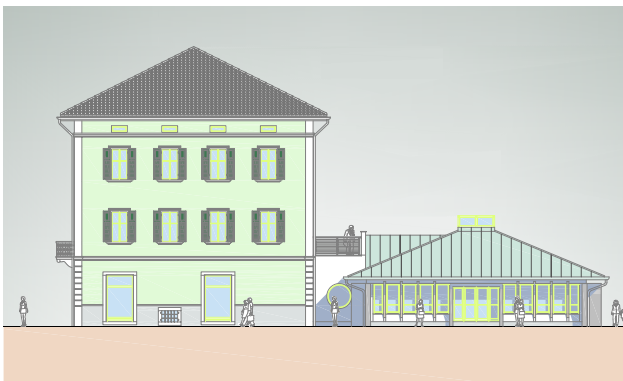
Progetto ristrutturazione edificio ex Famiglia Cooperativa

Queste importanti ristrutturazioni daranno risposte concrete alle esigenze delle nostre associazioni di volontariato, e nuovi spazi per migliorare i servizi dedicati alle famiglie.