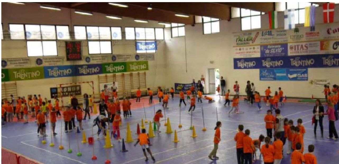
Festa dello Sport – maggio 2013

e un Arrivederci a settembre a tutti i bambini, i ragazzi e a tutto il personale della scuola che ogni giorno è impegnato, con competenze e compiti diversi sì ma tutti importanti, a sostenere gli alunni nei loro percorsi personali al fine di un loro successo formativo.