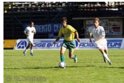
Ac Mezzocorona il sogno continua

mico sia in termini di strutture, anche perché oltre alla prima squadra professionistica il sodalizio investe notevolmente anche nel settore giovanile, mettendo a disposizione dei tanti iscritti tecnici preparati e motivati. A riguardo invitiamo i dirigenti dell'A.C. Mezzocorona a non perdere mai di vista l'attenzione che in passato hanno dimostrato per i nostri ragazzi.