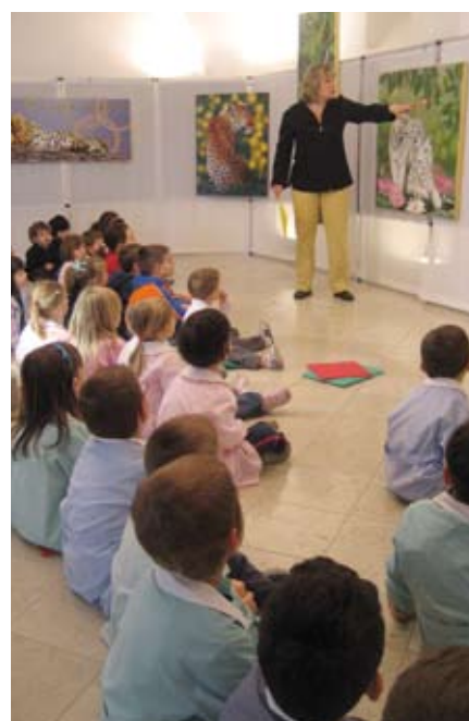
Visita guidata e laboratorio con la scuola materna alla mostra di Maurizio Boscheri presso Palazzo della Vicinia

La biblioteca chiude solo la settimana di ferragosto, buona estate in lettura a tutti.