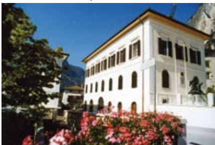
Palazzo della Vicinia vero fiore all'occhiello della borgata

Un ulteriore studio e catalogazione da farsi in collaborazione con la Soprintendenza Archeologica di Trento riguarderà i reperti archeologici recentemente acquisiti.