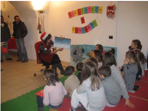
“ I laboratori dell'inverno scorso nella casa di babbo Natale ”

Molte infatti sono direttamente proposte dalle bibliotecarie quali i laboratori didattici per le scuole, oppure le letture animate con laboratorio a tema del tipo recentemente presentato con successo alla Casa di Babbo Natale a Palazzo Martini.