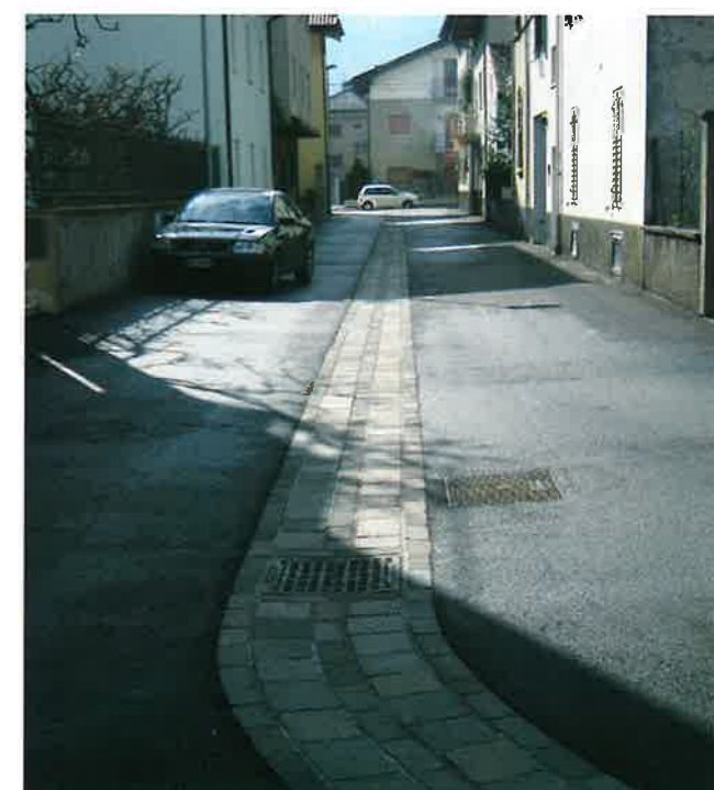
▲ Via Marconi