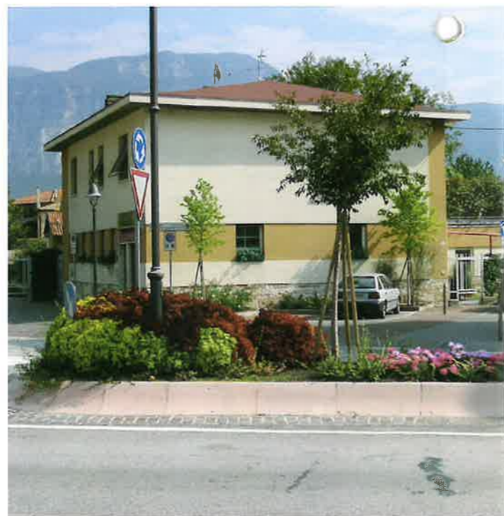
▲ Particolare attenzione alla cura del verde pubblico

In questi 5 anni, distribuendoli sul territorio, sono stati realizzati oltre 100 nuovi parcheggi pubblici, altri come i 35 nuovi posti in via Romana e i 45 in via Sottodossi sono in fase di realizzazione.