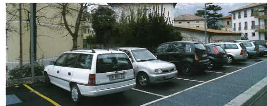
▲ Teer Center in via 4 Novembre (20 nuovi posti auto pubblici)