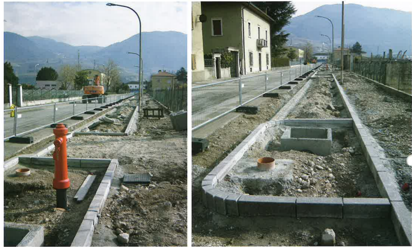
▲ Corso 4 Novembre

Corso 4 Novembre: posa del collettore acque bianche per l'eliminazione definitiva degli allagamenti a case e cantine ogni qualvolta vi era un grosso temporale. Realizzazione lavori di nuovo arredo urbano, con percorso ciclopedonale da e per la Stazione ferroviaria.