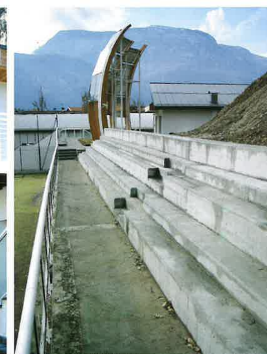
▲ Nuova tribuna