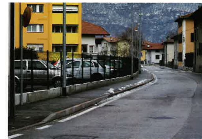
▲ Via Borgo Nuovo

Via Cesare Battisti: realizzazione nuova viabilità in corrispondenza della "stretta" con la realizzazione di un apposito marciapiede pedonale e l'installazione di un impianto semaforico a senso unico alternato.