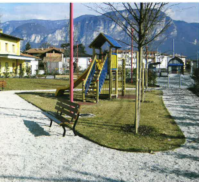
▲ Parco accanto alla stazione Trento-Malé

Corso 4 Novembre: posa del collettore acque bianche per l'eliminazione definitiva degli allagamenti a case e cantine ogni qualvolta vi era un grosso temporale. Realizzazione lavori di nuovo arredo urbano, con percorso ciclopedonale da e per la Stazione ferroviaria.