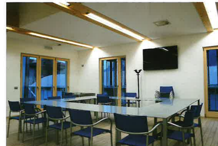
▲ Sala polivalente "Movida"