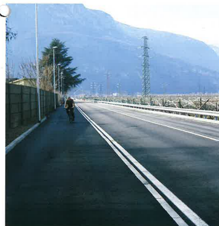
▲ Via del Teroldego