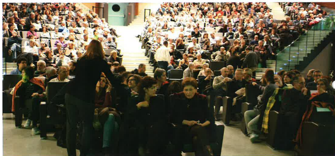
Il PalaRotari gremito

La serata al Palarotari è stata una tappa importante nella nostra lunga battaglia contro la costruzione dell'inceneritore, c'è stata la consapevolezza di quanto sia sentito questo problema dalla popolazione, di quanto sia importante questa battaglia per il nostro territorio e per la salute dei cittadini, ed infatti dopo la serata altri comuni hanno rotto gli indugi e si sono schierati apertamente, dal Palarotari è partito un messaggio importante verso gli amministratori della Provincia e del Comune di Trento, il messaggio che un'alternativa all'inceneritore è possibile, il messaggio che il trentino merita di meglio che la scelta di un impianto che inquinerebbe il nostro territorio per decenni.