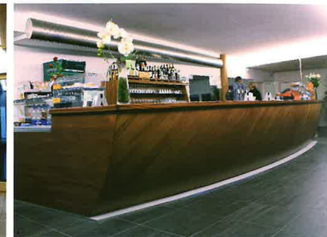
▲ Il bar con la sua caratteristica "chiglia" che richiama la "vela" sulla quale sono posti i pannelli fotovoltaici e solari