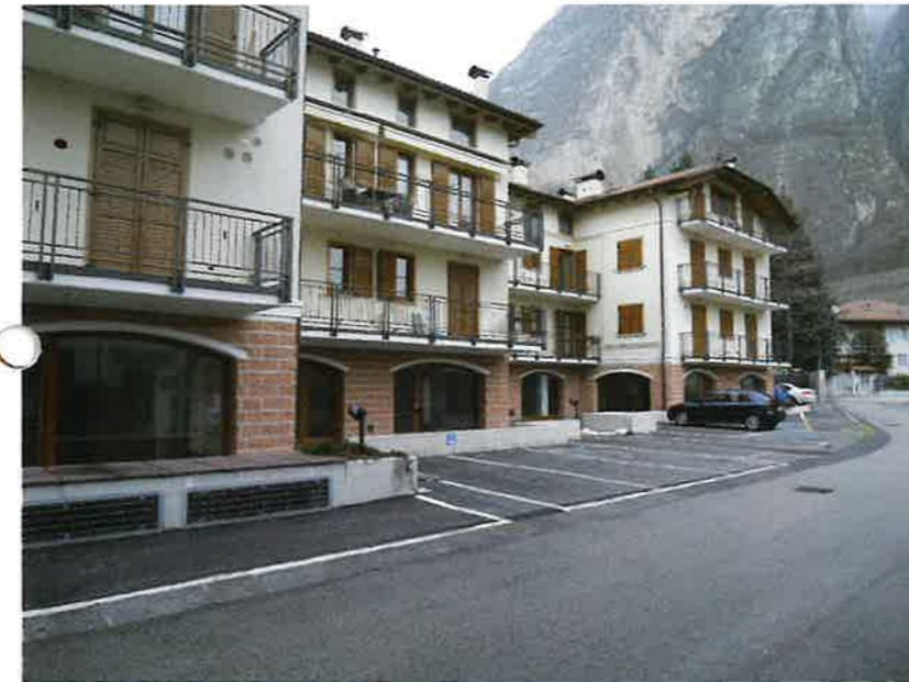
▲ Via Conte Martini (15 nuovi posti auto pubblici)

In questi 5 anni, distribuendoli sul territorio, sono stati realizzati oltre 100 nuovi parcheggi pubblici, altri come i 35 nuovi posti in via Romana e i 45 in via Sottodossi sono in fase di realizzazione.