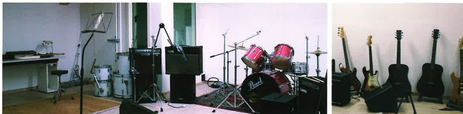
▲ Sala Musica

Al piano superiore, ha trovato dimora il Centro Giovanile, con un'attrezzata sala musicale, un'ampia sala polivalente (60 metri quadrati) e tutti gli spazi necessari per dare ai nostri giovani la possibilità di confrontarsi, crescere e partecipare.