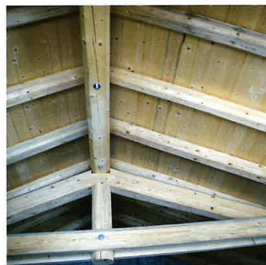
▲ Bait dei boscheri: com'era e il restauro