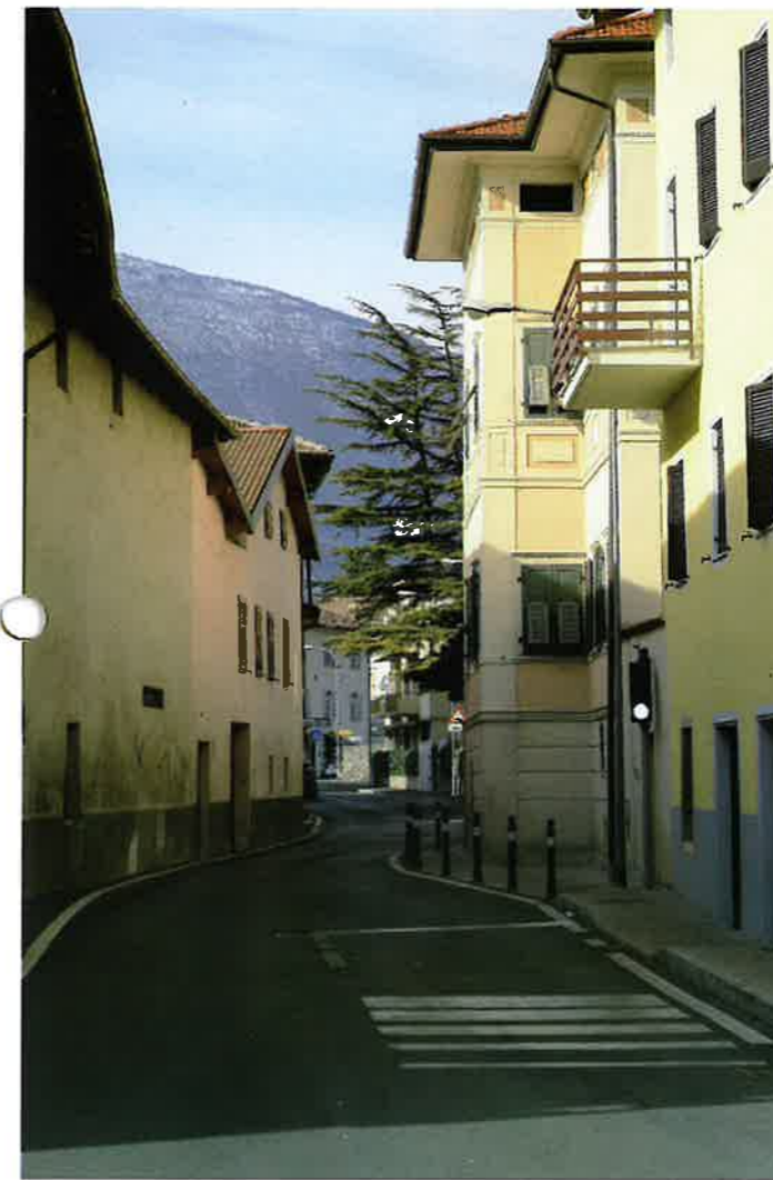
▲ Via Cesare Battisti