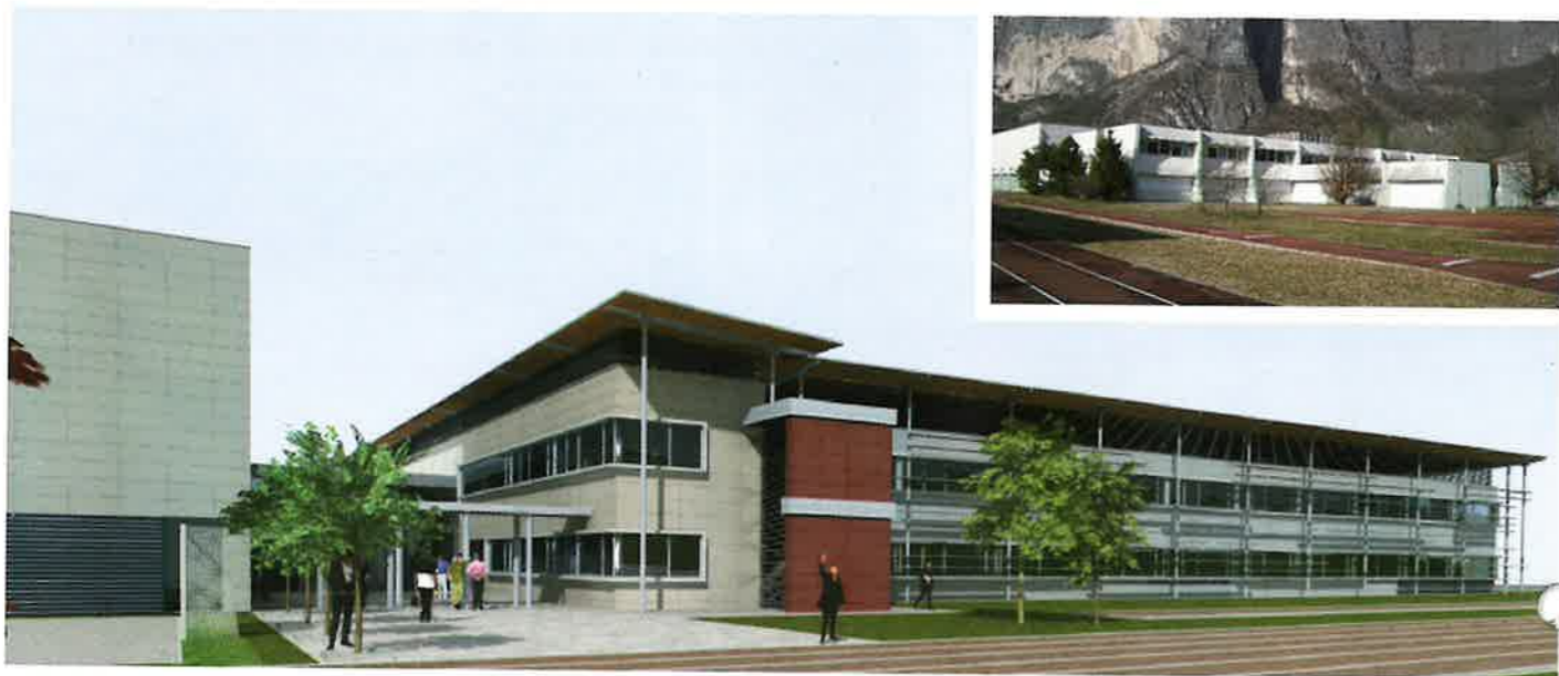
◀ In alto a destra la struttura esistente, nelle altre immagini i rendering del progetto

È stata progettata la nuova sede dell'Istituto Comprensivo. Il nuovo edificio sarà costruito con le caratteristiche del risparmio energetico e secondo i rigidi disposti della certificazione Leed.