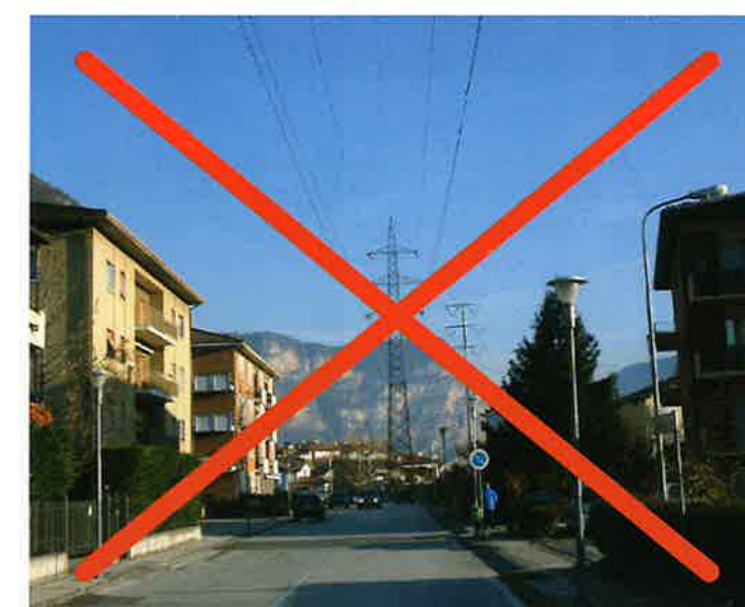
▲ L'ingombrante traliccio che verrà tolto

Poteva sembrare impossibile l'interramento di un elettrodotto, troppi gli ostacoli tecnici e burocratici, poi l'intuizione, passare sotto una strada comunale attraverso le campagne, e da lì tutto è diventato più facile. I lavori sono in corso ed entro agosto l'elettrodotto Terna sarà tolto per sempre dal centro abitato.