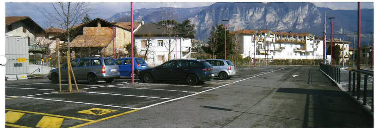
▲ Stazione Trento-Malé (70 nuovi posti auto pubblici)