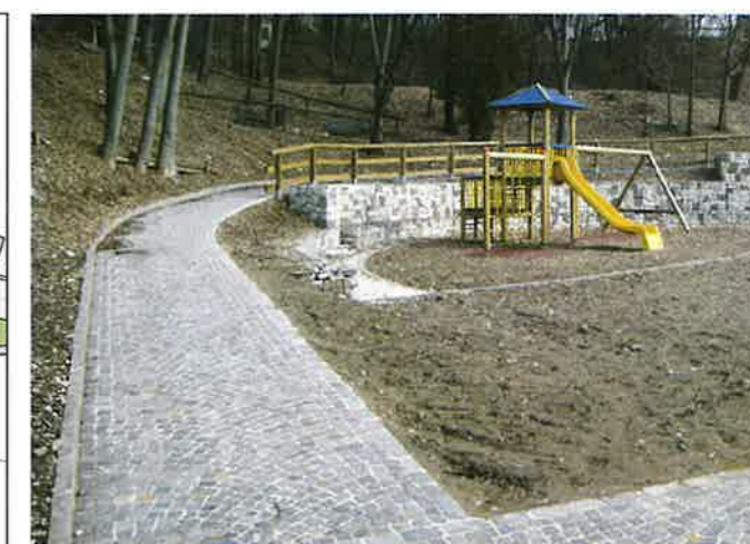
▲ Scorcio del parco in fase di realizzazione