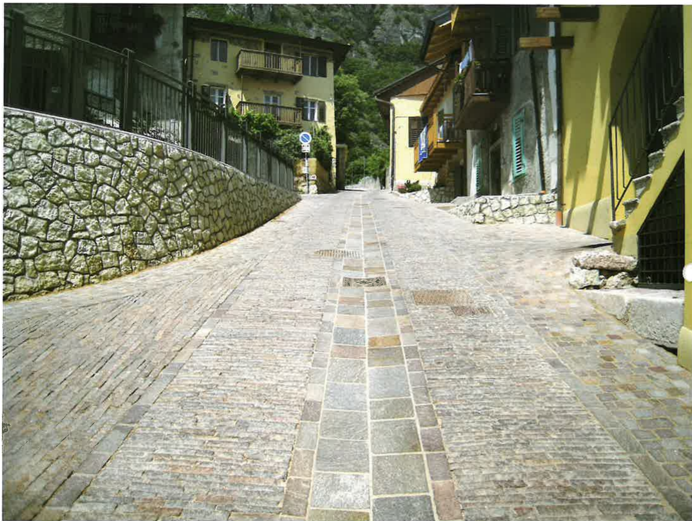
▲ Via alla Grotta