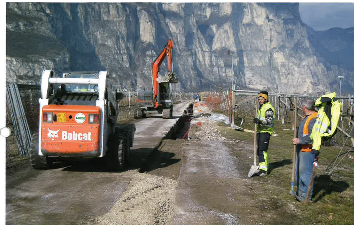
▲ Fasi dell'interramento