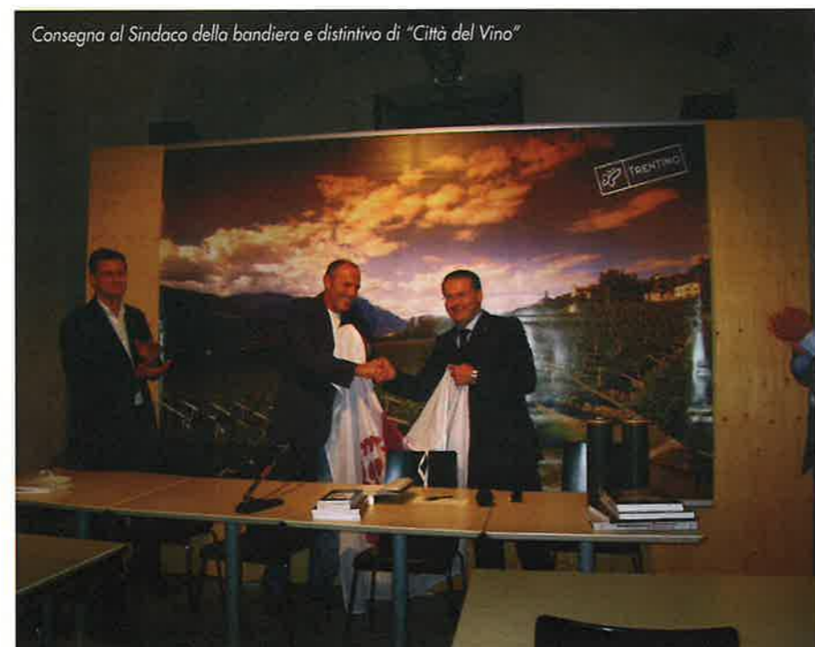
Consegna al Sindaco della bandiera e distintivo di "Città del Vino"

Assessore alle Attività Culturali, Turismo e Agricoltura