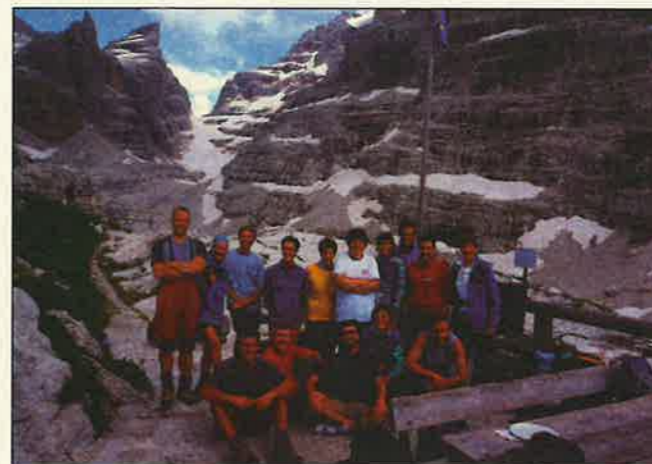
Grandi e piccoli in gita con la Sat