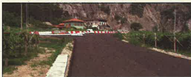
La circonvallazione tanto attesa ha preso forma.