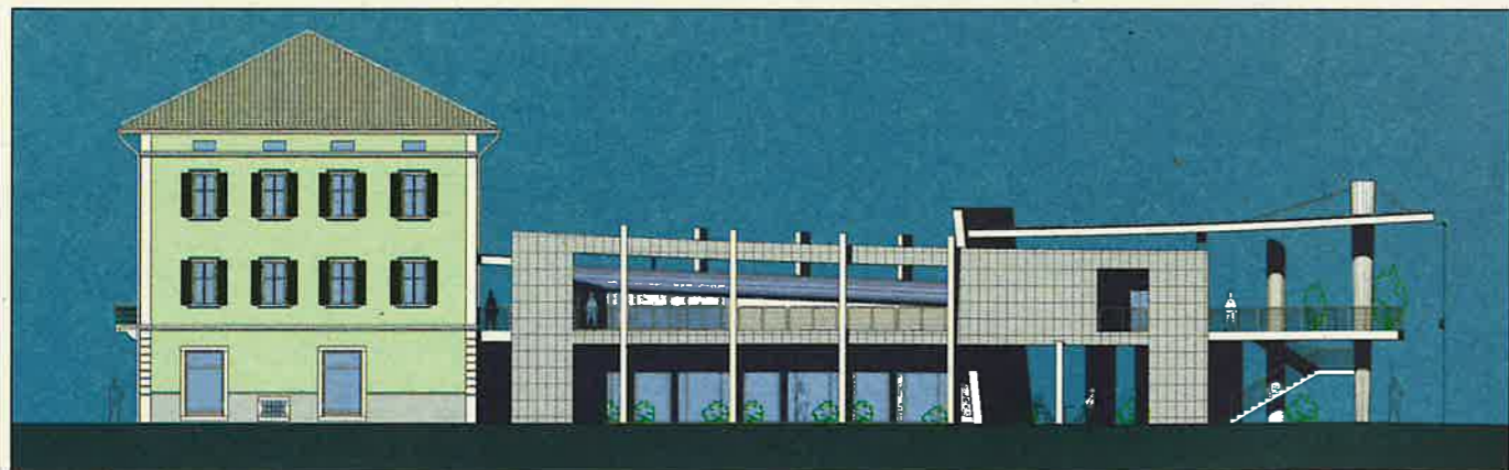
La planimetria della nuova struttura destinata a spazi e servizi sociali

La struttura è realizzata in adiacenza al prospetto sud-est del corpo storico, ed è costituito, sostanzialmente da un salone, concepito per un uso pubblico