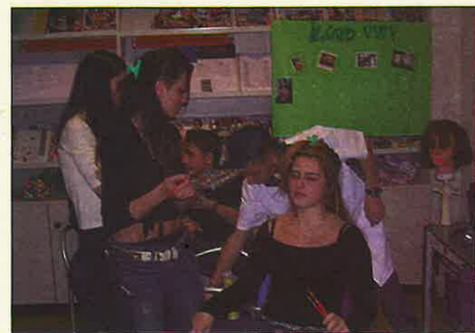
I ragazzi di Telemaco all'opera

Le attività del progetto si sono svolte con programmi diversificati per il periodo scolastico e quello estivo. Se nel primo le attività si sono perlopiù svolte presso la sede di Via F.lli Grandi e le strutture sportive, durante le vacanze i luoghi di ritrovo privilegiati sono stati il lido di Egna (Estate Giovani), il Centro