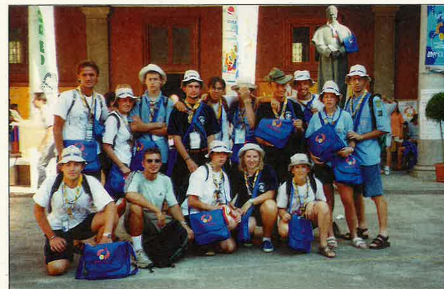
Gli scout di Mezzocorona che hanno partecipato al Giubileo dei giovani del 2000.