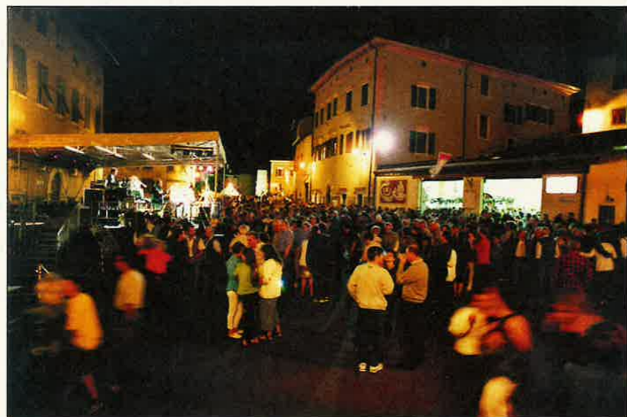
Pubblico entusiasta e numeroso al Settembre Rotaliano