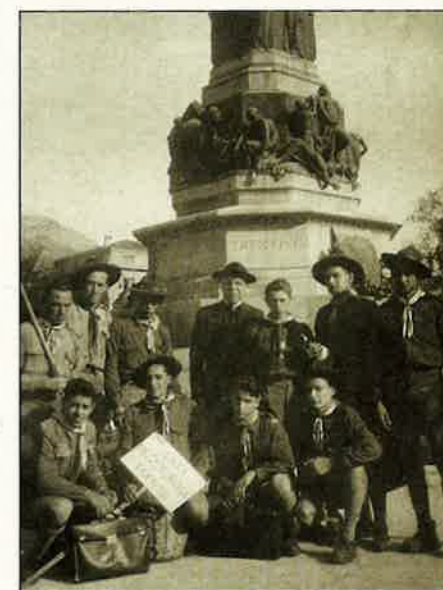
Gli scout di Mezzocorona al ritorno dal Giubileo del 1950

a nanna. I giorni si susseguono, i Km sulle nostre gambe aumentano ma la fatica lascia sempre più il posto alla voglia e alla gioia d'arrivare; pernottiamo ad Acquapendente, Vetralla, e Bracciano; da buoni e fortunati Pellegrini, le Parrocchie che incontriamo sulla strada ci accolgono a braccia aperte nonostante il nostro mancato preavviso. Ogni giorno a coppie cuciniamo sui nostri fornelli a gas e incredibilmente troviamo tutto, o quasi, buonissimo; i momenti di svago si alternano a quelli di riflessione e il gruppo è sempre più unito. Eccoci dopo 5 giorni di strada e condivisione arrivare a Ladispoli, da dove dopo un bagno ristoratore nel mare laziale, seguiamo in treno fino a Guidonia. Qui l'Associazione Piccola Pietra (casa famiglia) ci ospita per 3 giorni e noi in cambio ci mettiamo al loro servizio. Chi sistema il prato, chi dà una mano nelle pulizie, chi s'improvvisa "potatore" di siepi e chi gioca con i bambini ospiti della comunità, tutti