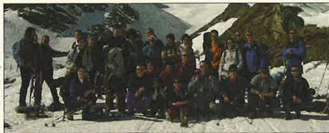
I Satini in una delle loro uscite in montagna

Austria e Italia (Carnia), il Pai Piccolo, luogo di sanguinose battaglie durante la Grande Guerra. L'ultima gita in programma per domenica 10 ottobre, sarà una Gita Intersezionale sul Fausior, in collaborazione con le Sezioni Sat di Mezzolombardo, di S. Michele A/a, e con gli amici del Cai di Salomo. Infine domenica 14 novembre chiuderemo l'attività con il tradizionale pranzo sociale. Ricordiamo che le iscrizioni alle nostre attività si possono effettuare presso il bar Krone, mentre