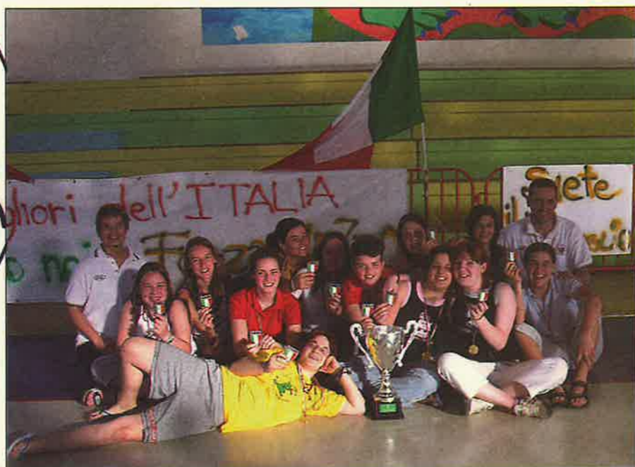
Le ragazze Campionesse d'Italia 2004 - Under 18

La squadra Under 18 femminile Campione d'Italia