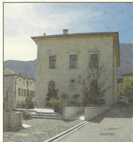
La nuova sede della Biblioteca Comunale

Preme sottolineare quanto gli utenti abbiano contribuito in vari modi a creare un progetto "su misura" per la