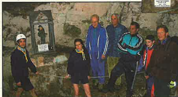
Gli scout posano la targa del 50° anniversario