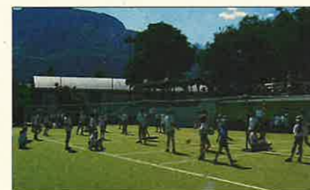
Gran successo per i corsi estivi di Mini Volley

Cominciamo con la Serie C, massimo campionato regionale. Ri-confermare il terzo posto dell'anno precedente si sapeva che era impossibile, visto che venivano a mancare due pezzi da novanta e che le nuove entrate avrebbero dovuto trovare l'amalgama con le altre. Si voleva inoltre inserire alcune nostre giovani atlete. L'obiettivo salvezza è comunque stato raggiunto in anticipo e con