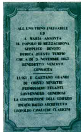
Mezzocorona, Chiesa arcipretale di santa Maria Assunta, lapide che ricorda la consacrazione del 3 novembre 1867.