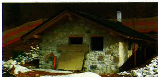
Prima e dopo i lavori

mente identificato come il "Bait dei Manzi", sia stato realizzato prima del '900. La piccola costruzione era stata occasionalmente utilizzata come ricovero notturno fino al primo dopo guerra (1948-50), sia dai boscaioli che dalla popolazione in genere, la quale si recava nei dintorni a raccogliere legna e ramaglie da ardere. Da queste testimonianze il forse di chiamarla "Bait dei Boscheri".