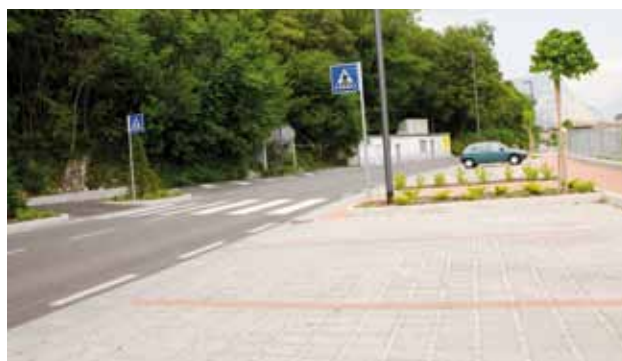
I nuovi posti auto di via Sottodossi

Si darà corso all'intervento di riqualificazione di Corso