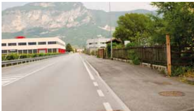
Anche in via Teroldego nuovo collettore di acque bianche

Nel settore delle opere pubbliche il 2012 vedrà innanzitutto la realizzazione del nuovo collettore acque bianche in Via Teroldego, unitamente al completamento della ciclopedonale fino a Piazza Trento, la nuova rete di raccolta acque meteoriche e la nuova pubblica illuminazione anche sul tratto di strada che dall'incrocio con Via S. Antonio conduce alla zona artigianale-produttiva.