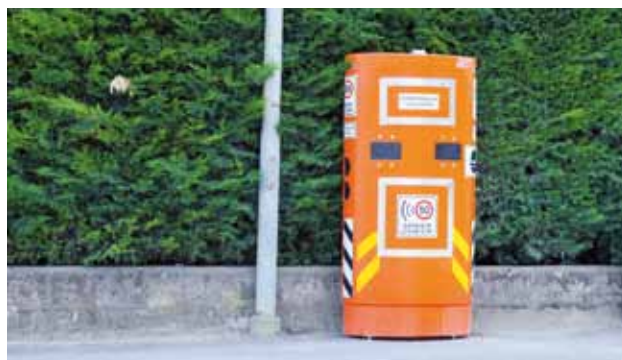
A breve verranno installati nuovi speed check in paese

Si porrà attenzione anche ad altri aspetti di minor entità