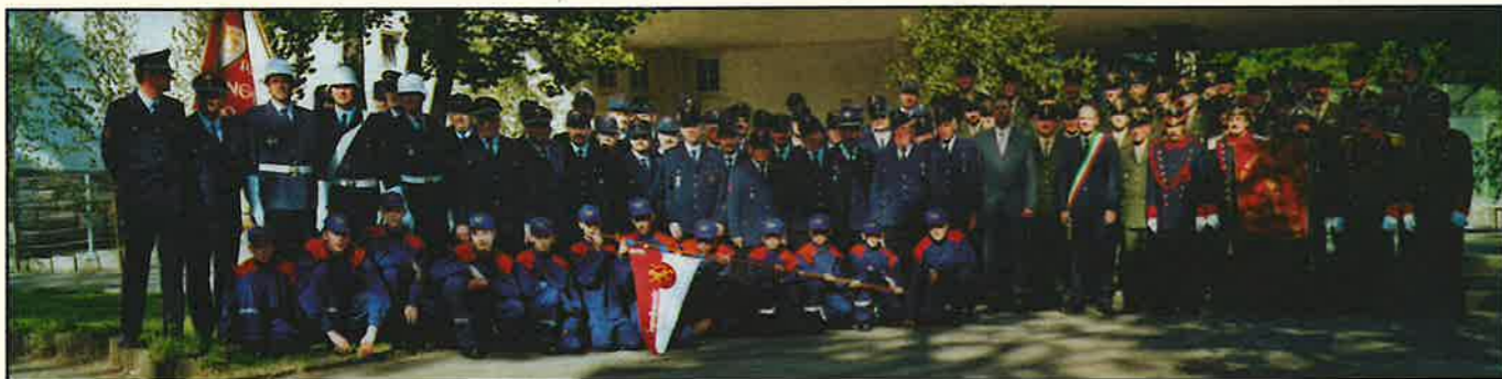
Una foto di gruppo durante il gemellaggio del 2002 tra i Vigili del Fuoco di Mezzocorona e quelli di Dußlingen

Tutto ciò a confermare che si possono gettare dei ponti all'insegna della cultura e che lo scambio interculturale è sempre un arricchimento.