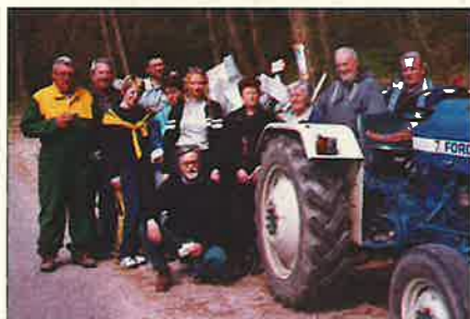
Una foto di gruppo durante la giornata di raccolta rifiuti

Il 29 marzo 2003, nell'ambito della giornata ecologica organizzata dalla sezione di Mezzocorona del WWF Trentino-Alto Adige (ADA-WWF), si è provveduto alla raccolta dei rifiuti disseminati lungo l'argine del torrente Noce, presso la località Ischia, meta suggesti-