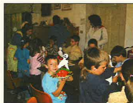
Un momento del corso di MANIABILI che si è appena concluso

Nata in via sperimentale nel mese di ottobre del 2001 e con alle spalle l'esperienza decennale del Circolo, l'iniziativa si ripropone di occupare creativamente i bambini nei mesi invernali, e si rivolge alle prime tre classi delle scuole elementari. Gli incontri hanno avuto cadenza mensile e si sono svolti nella giornata di sabato dalle 14.00 alle 16.00, presso la sede del C.C.R. IL MELOGRANO in Via F. De Luca a Mezzocorona.