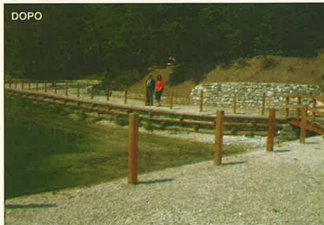
Una veduta del laghetto in località Ischia prima e dopo i lavori di ripristino