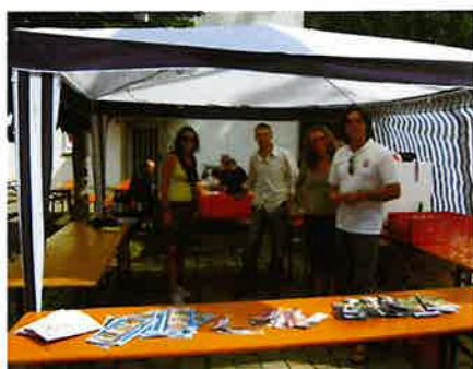
La pro loco impegnata a Dusslingen

Apprezzato è stato anche e soprattutto lo stand di promozione turistica predisposto dalla nostra Pro Loco che per due giorni ininterrotti, oltre alla degustazione dei nostri prodotti, ha distribuito del materiale turistico rispondendo con professionalità e simpatia ad ogni richiesta di informazione. Sicuramente un bel biglietto di presentazione che ha riscosso grande interesse e gradimento e che ha contribuito ad allacciare e