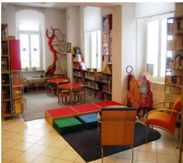
(lo spazio dedicato ai bambini)

Sia dal punto di vista logistico, sia dal punto di vista delle risorse, siamo consapevoli di essere una biblioteca fortunata, soprattutto quando ci confrontiamo con le altre.