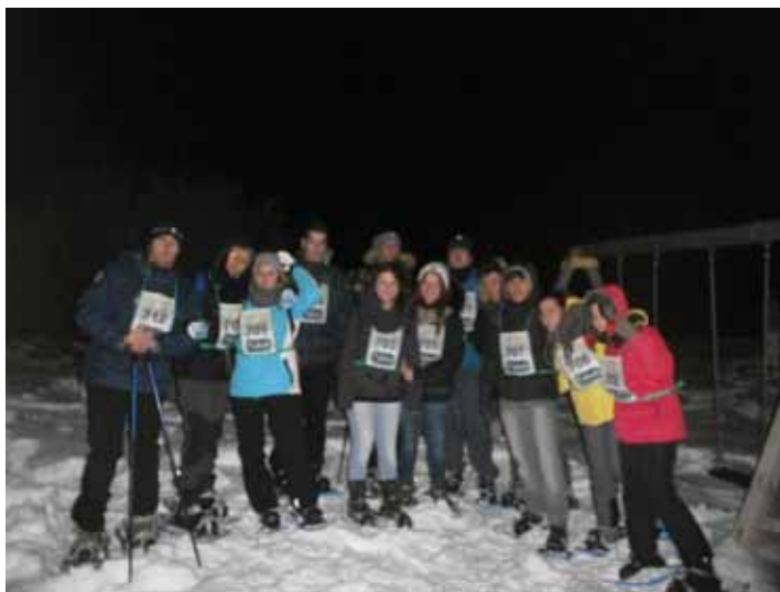
Lo Spazio Giovani alla “Ciaspolata al chiaro di luna”

Questi progetti promossi con l'Istituto Comprensivo locale e le iniziative future intendono offrire un'immagine di Spazio Giovani sempre più focalizzata sul “network sociale” della borgata e sul territorio limitrofo per garantire sempre più a ragazzi e giovani occasioni per conoscersi, partecipare, impegnarsi e socializzare non solo sulle “piazze virtuali”.