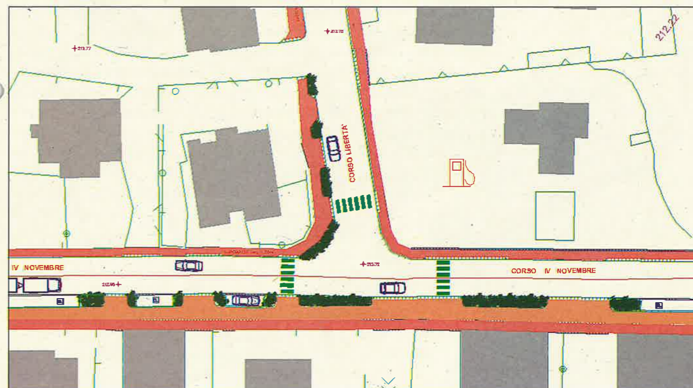
Nel rendering sono evidenziati i tratti che verranno modellati dai nuovi lavori di sistemazione della viabilità in Corso Libertà e in Corso IV Novembre