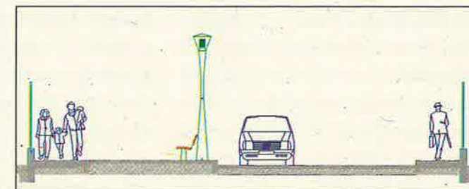
Visione in sezione della percorribilità dei viali con il nuovo arredo

Congiuntamente ai lavori dianzi descritti si dovrà operare la sistemazione ed il potenziamento del collettore acque bianche che scorre lungo l'intero Corso 4 Novembre. Si tratta di un primo intervento ritenuto prioritario da un recente studio preliminare sullo