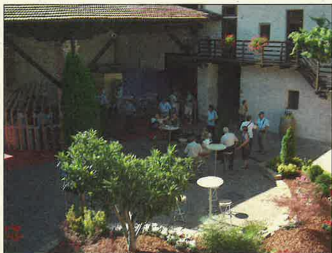
La degustazione del Teroldego nell'edizione 2004 del Settembre Rotaliano

del "Rio Piaget" con messa in sicurezza della presa d'acqua al Monte.