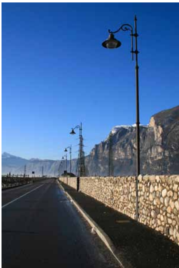
"Continuano i lavori di pavimentazione delle strade"

Verrà dato corso ai lavori di asfaltatura di un tratto di via Canè già assegnati ma non realizzati a causa del sopraggiungere della stagione invernale.