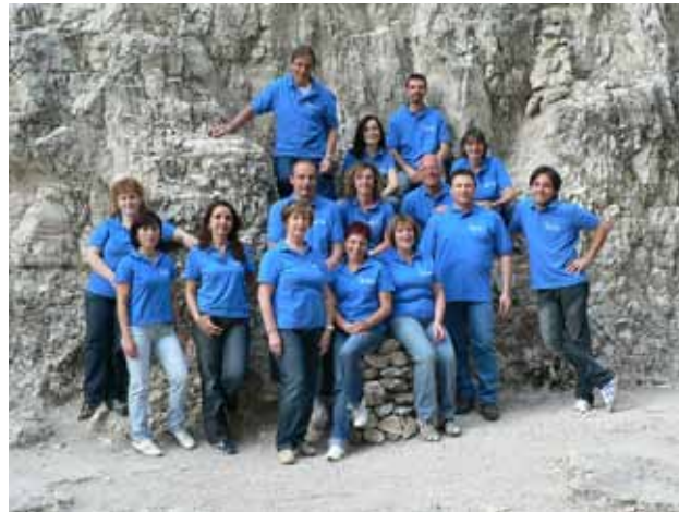
"Una foto del gruppo premiato al concorso nazionale"

In campo culturale sono attive numerose associazioni. Quest'anno per primo vorrei menzionare il "Coro Rigoverticale" che lo scorso novembre ha vinto il primo premio ad un concorso nazionale di composizione e canto corale.