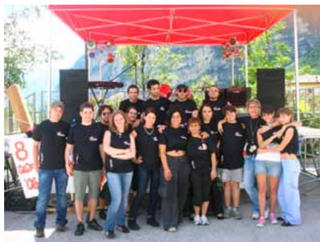
"Continua l'attività di Telemaco"

Costante è la collaborazione di Telemaco con tante realtà della Borgata: Associazioni, Scuola, Oratorio.