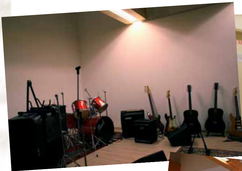
"Telemaco e la musica"