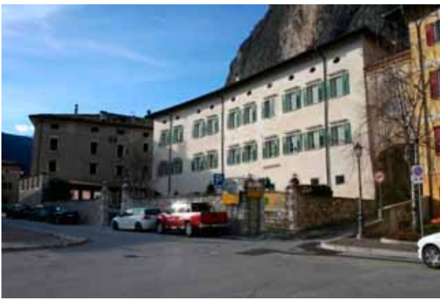
"a breve risanamento dello storico palazzo della borgata"

Per quanto riguarda Palazzo Firmian è previsto il risanamento degli intonaci e successiva tinteggiatura delle pareti dell'edificio nonché la riverniciatura sia delle ante d'oscuro che delle parti lignee del corpo Anagrafe, usufruendo di un contributo provinciale per il recupero delle facciate degli edifici in centro storico.