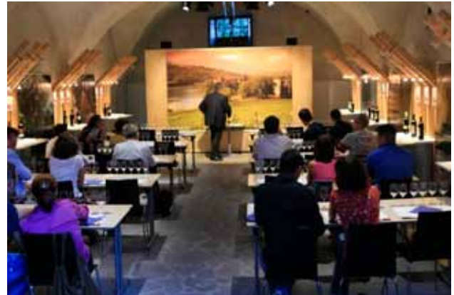
"La festa del Settembre Rotaliano vede ogni anno migliaia di visitatori"

La Pro Loco diventa così uno strumento per la valorizzazione delle risorse turistiche del territorio, in modo particolare per quanto concerne la ricettività, i prodotti enogastronomici e gli eventi. Il "Settembre Rotaliano" è una festa apprezzata e conosciuta che vede la presenza di migliaia di persone provenienti anche da fuori provincia, oltre alla gemellata Dusslingen.