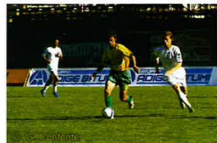
Ac Mezzocorona il sogno continua

mico sia in termini di strutture, anche perché oltre alla prima squadra professionistica il sodalizio investe notevolmente anche nel settore giovanile, mettendo a disposizione dei tanti iscritti tecnici preparati e motivati. A riguardo invitiamo i dirigenti dell'A.C. Mezzocorona a non perdere mai di vista l'attenzione che in passato hanno dimostrato per i nostri ragazzi.