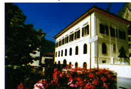
Palazzo della Vicinia vero fiore all'occhiello della borgata

Un ulteriore studio e catalogazione da farsi in collaborazione con la Soprintendenza Archeologica di Trento riguarderà i reperti archeologici recentemente acquisiti.