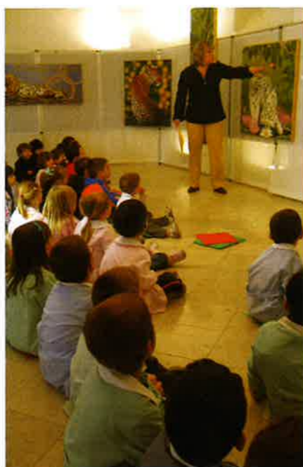
Visita guidata e laboratorio con la scuola materna alla mostra di Maurizio Boscheri presso Palazzo della Vicinia

La biblioteca chiude solo la settimana di ferragosto, buona estate in lettura a tutti.