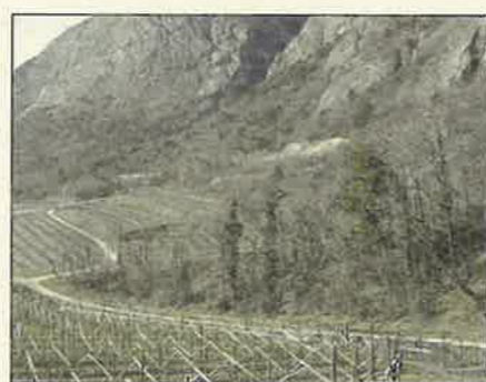
La strada delle longhe

Durante la Primavera sarà messo in sicurezza il tratto roccioso soprastante la strada delle Longhe in vicinanza del centro abitato del monte per una lunghezza di circa 400 metri. La realizzazione del sentiero didattico in collaborazione con il Servizio Forestale della PAT è quasi terminato e in maggio sarà consegnato alla