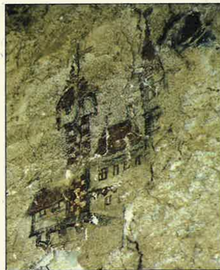
Castel San Gottardo il dipinto recentemente scoperto

Il periodo in cui fu dipinto non può essere molto antico, sia perchè il fabbricato centrale è l'ultimo realizzato in ordine di tempo, sia perchè il castello rappresentato sembrerebbe posteriore al '500. Ad ogni modo non è neppure una pittura recentissima, perchè deve essere stata fatta prima che venisse chiusa la porta, che dava sul poggiolo. Ora considerando che l'eremo è stato abbandonato alla fine del 1700 è presumibile che l'opera sia stata dipinta tra il 1600 ed il 1700.