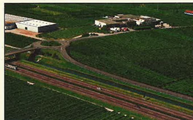
Ecco come sarà la circonvallazione

L'altro importante progetto è la revisione del Piano Regolatore Generale. Nel 2003 è stato dato apposito incarico ai tecnici urbanisti e sono state all'unanimità approvate delle linee guida contenenti delle precise indicazioni politiche al fine di adattare lo strumento