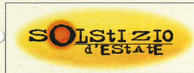
Solstizio d'Estate proposto dal Gruppo Arte Mezzocorona. Iniziativa alla XIV edizione attesa per la prossima estate.