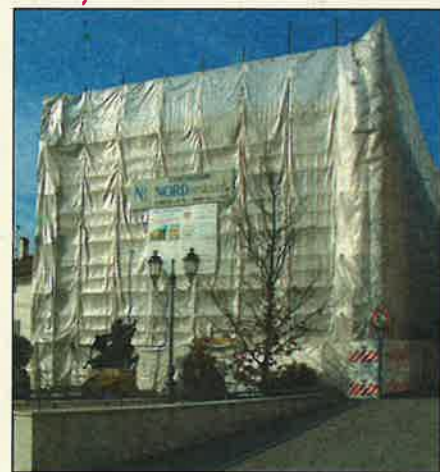
L'ex Municipio durante i lavori di restauro

mente lo slittamento di un anno ma che sicuramente saranno concretizzate nel corso del 2004.