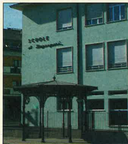
Le scuole elementari

L'edificio scolastico è stato oggetto di consistenti lavori di risanamento, gli ultimi dei quali eseguiti nel corso dell'estate ed autunno scorsi. Hanno riguardato la tinteggiatura esterna e la sistemazione dei piazzali esterni. Nel corso dell'estate prossima è prevista la tinteggiatura di parte dei locali interni e nel 2005 la parte rimanente.