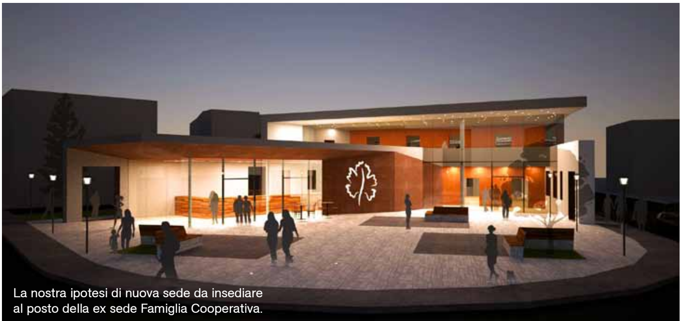
La nostra ipotesi di nuova sede da insediare al posto della ex sede Famiglia Cooperativa.