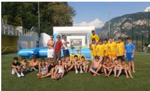
AcquaSpalsh Spazio Giovani

Torniamo ora all’inizio e insieme ai lettori “sfogliamo” l’album dell’estate 2012 per ricordare le tante iniziative che hanno offerto ai giovani della nostra borgata varie occasioni di aggregazione, di svago e di momenti volti ad accrescere abilità e competenze.