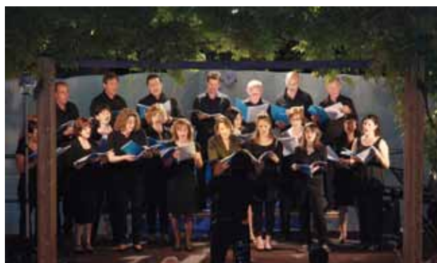
1 giugno 2012 - 10 primavera in Coro - Concerto per il decimo anniversario del Coro Rigoverticale

In occasione dei festeggiamenti per il decimo anniversario di attività del Coro Rigoverticale, il 14 dicembre alle ore 20.30 nella Chiesa di S. Maria Assunta sarà ospite del Coro il Sängerkranz Dußlingen, formazione corale presente da molti anni nella cittadina tedesca gemellata con Mezzocorona, che si esibirà in un concerto di Natale per la comunità.