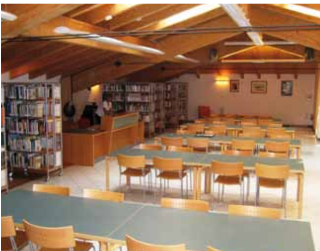
Una veduta della nuova sala, luminosa