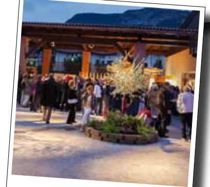
La mostra del Teroldego