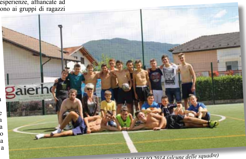
"PORTE APERTE ALLO SPAZIO GIOVANI" 10 LUGLIO 2014 (alcune delle squadre)

Tante attività, tanti incontri...occasioni per approfondire rapporti sia tra pari che con gli educatori. Relazioni che diventano punti di riferimento significativi e possono accompagnare i ragazzi traghettandoli alla vita adulta, rinforzando le identità personali, aiutandoli ad uscire dall'individualismo, aiutandoli a passare dall' "io" al "noi".