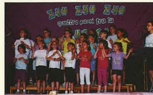
Le giovani voci impegnate in un concerto