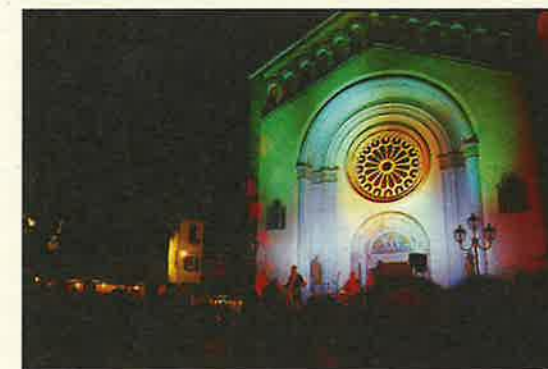
Serate di musica luci e spettacolo hanno animato il centro storico di Mezzocorona