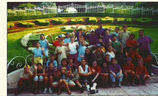
Il "Lunedivertiamoci" a Gardaland