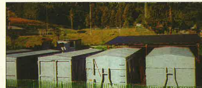
Un esempio di come potrebbe essere realizzato il Centro Raccolta Materiali di Mezzocorona.