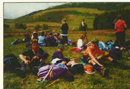
Un momento di pausa durante un'escursione in montagna

più piccoli del branco con i loro capi, mentre nel prato vicino, cintato dal bosco, hanno attrezzato il loro campo con le tende e le cucine, le squadriglie del reparto, i ragazzi più grandi del clan invece hanno montato le loro tendine nelle piazzole costruite nel bosco. Un avventuroso personaggio ha aiutato tutti i ragazzi nello sperimentarsi durante il campo: il giovane ragazzo Kim. Orfano di genitori inglesi trasferiti in India, vive di espedienti con intraprendenza e creatività ma comunque in una situazione di abbandono fin all'incontro con il Lama che lo aiuta ad orientarsi e a costruirsi una formazione; entrambi hanno un sogno da realizzare e in questa ricerca il ragazzo comprende che i valori importanti non sono la gloria e il potere bensì "acquisire meriti" attraverso il servizio agli altri e lo sviluppo delle proprie competenze. Le nostre giornate iniziavano sempre con un momento d'incontro tutti assieme scandito dall'alzabandiera, la condivisione e la riflessione di un brano degli Atti degli Apostoli e la conoscenza di nuove vicende della storia di Kim, quindi ogni unità cercava di vivere la giornata in comunione interpretando a proprio modo le attività proposte dai capi. Il servizio, i giochi, le uscite, le scoperte, le abilità manuali, le canzoni, i fuochi di bivacco, la gara di cucina, la "cucina sopravvivenza", la veglia francescana, la route sulle cime