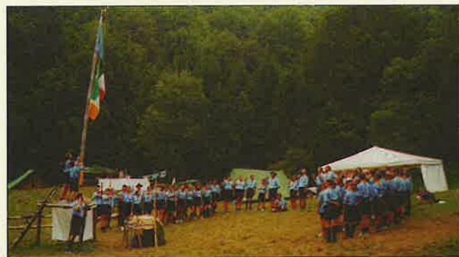
Un momento importante di ritrovo, l'alzabandiera al Campo.