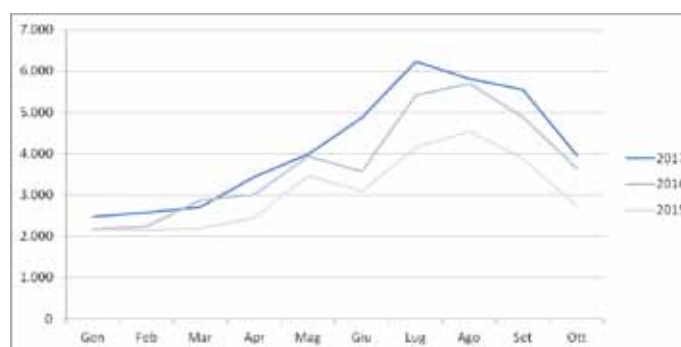
Figura 1: Arrivi Turistici (gennaio-ottobre)

gli ospiti tedeschi rappresentano ben più della metà dei turisti stranieri nel nostro territorio. A fronte del leggero calo (-5%) della permanenza media totale (il rapporto tra presenze turistiche ed arrivi turistici, che si attesta a 1,92 notti nell'anno corrente), i tedeschi mostrano una controtendenza, con una durata media del soggiorno pari a 1,51 notti (+43% rispetto al 2016): quindi, se prima erano solo di passaggio, ora molti di loro decidono di sostare per almeno due notti, dimostrando di apprezzare l'offerta del nostro territorio. Risulta pertanto importante concentrare gli sforzi per offrire un'accoglienza sempre migliore a questo pubblico, che può offrire notevoli prospettive di crescita a tutti i nostri operatori turistici.