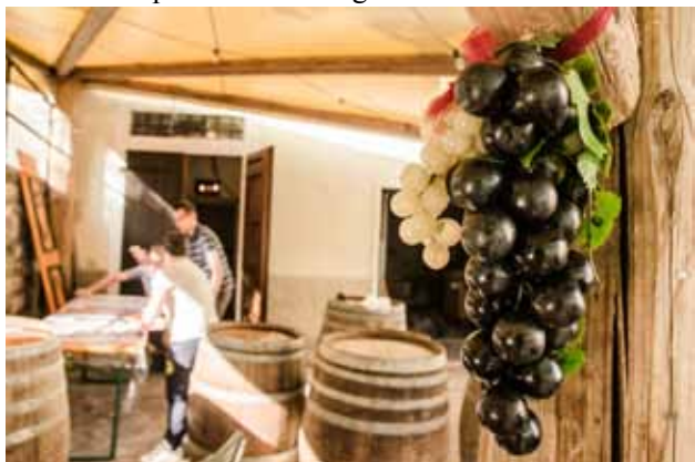
"Un momento della preparazione degli stand"

Molto frequentate le mostre d'arte, di pittura e fotografia e le attività per i bambini organizzate dalle associazioni