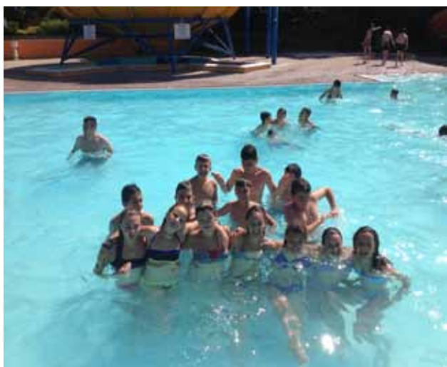
Gita Estate Giovani 2013 – Parco Acquatico "Rio Valli"

Dopo una ricca estate, caratterizzata dalla Colonia diurna "Spazio d'Estate" che ha visto in azione gli educatori dell'APPM – Onlus affiancati da alcuni animatori rigorosamente "locali" ed alcuni giovani volontari e dalla collaborazione con l'Estate Giovani, allo Spazio Giovani è tempo di "cambio stagione". Con l'inizio del nuovo anno scolastico e con l'arrivo dell'autunno sono riprese le iniziative quotidiane e sono in cantiere diversi progetti da proporre ai giovani frequentanti del Centro....E molti, speriamo, verranno proposti dai giovani stessi. Sono riiniziati i corsi musicali, come al solito molto ri-