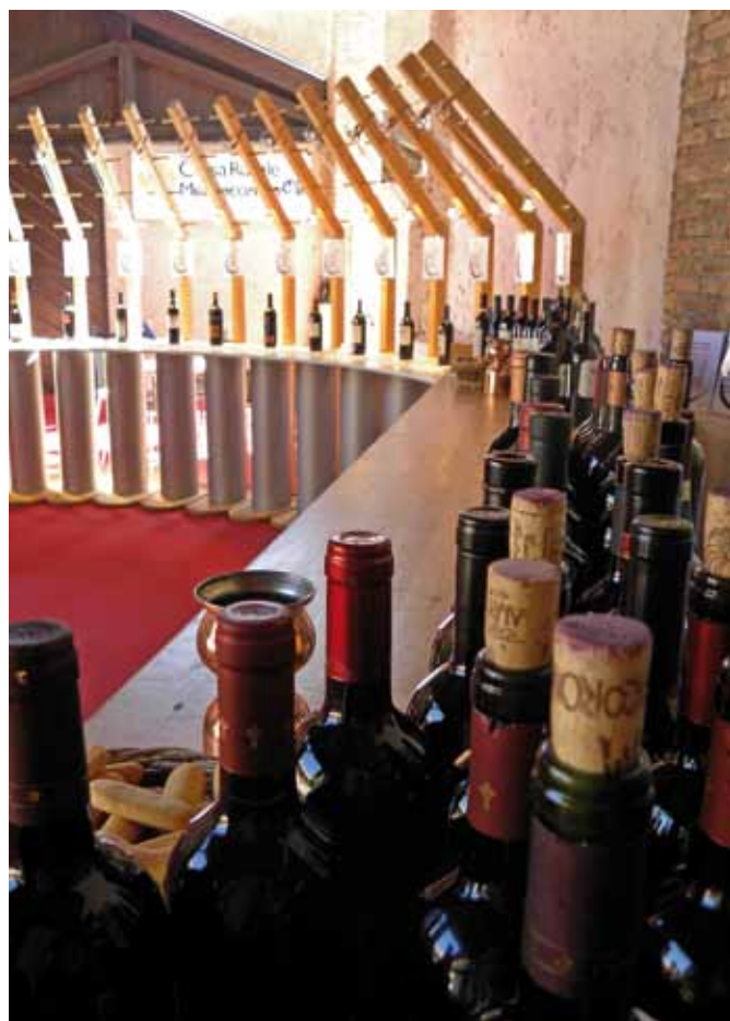
Un momento della mostra del Teroldego, durante il Settembre rotaliano"

Un cenno particolare lo rivolgo, come sempre, alla nostra Pro Loco che con impegno sta realizzando un programma di promozione della nostra borgata dal punto di vista economico e turistico. Il "Settembre Rotaliano" è una festa apprezzata e conosciuta che vede la presenza di migliaia di persone provenienti anche da fuori regione, oltre ai consueti amici del comune gemellato di Dusslingen che numerosi in tal occasione ci fanno visita e con il quale sono stati instaurati proficui contatti che coinvolgono la Scuola, le Associazioni e singole famiglie.