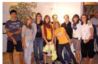
Alcuni ragazzi degli scambi familiari degli anni scorsi